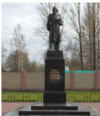
Памятник М.Е. Салтыкову-Щедрину в п. Лебяжье (Ломоносовский р-он Ленинградской области) (2011, проект Академии имени Штиглица). Установлен на месте, где находился дом, в котором жил писатель в 1878-1879 гг.

В 1878 году Михаил Евграфович Салтыков-Щедрин приобрел мызу в п. Лебяжье (Ломоносовский р-н) и построил усадьбу, дав ей название «Монрепо». Здесь позднее была написана повесть «Убежище Монрепо». Произведение закрепило за автором цитату «Я люблю Россию до боли сердечной и даже не могу помыслить себя где-либо кроме России». Салтыков-Щедрин пытался вести хозяйство, общался с местными крестьянами. Здание круглого дачного домика, сохранялось в Лебяжье до 1912 г., затем было разобрано из-за ветхого состояния. В августе 2011 г. на месте старой усадьбы установлен памятник писателю.