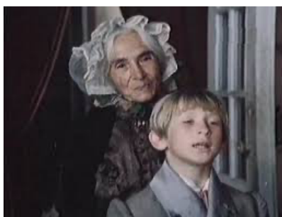
Кадр из фильма «Пошехонская старина»

ГОСПОДА ГОЛОВЛЕВЫ [2010] [Электронный ресурс]: худ. фильм по одноименному роману М.Е. Салтыкова-Щедрина / режиссер А. Ерофеева; композитор П. Климов; в главных ролях – П. Агуреева, Д. Суханов, Л. Полякова. – Россия. – [91 мин.] //URL: https://www.kinopoisk.ru/film/579628/ (дата обращения: 16.12.2025).