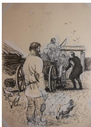
Муратов Н.Е. Иллюстрация к произведению М.Е. Салтыкова-Щедрина «Господа Головлевы»

САЛТЫКОВ-ЩЕДРИН, М.Е. Господа Головлёвы. Сказки / М. Салтыков-Щедрин. – Москва : АСТ МОСКВА : Транзиткнига, 2006. – 412 с.