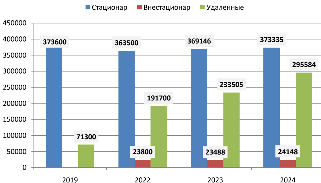
График 1 График динамики количества пользователей за три года и 2019 г. в регионе