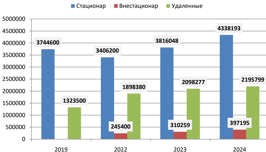
График 2 График количества посещений за три года и 2019 г. в регионе