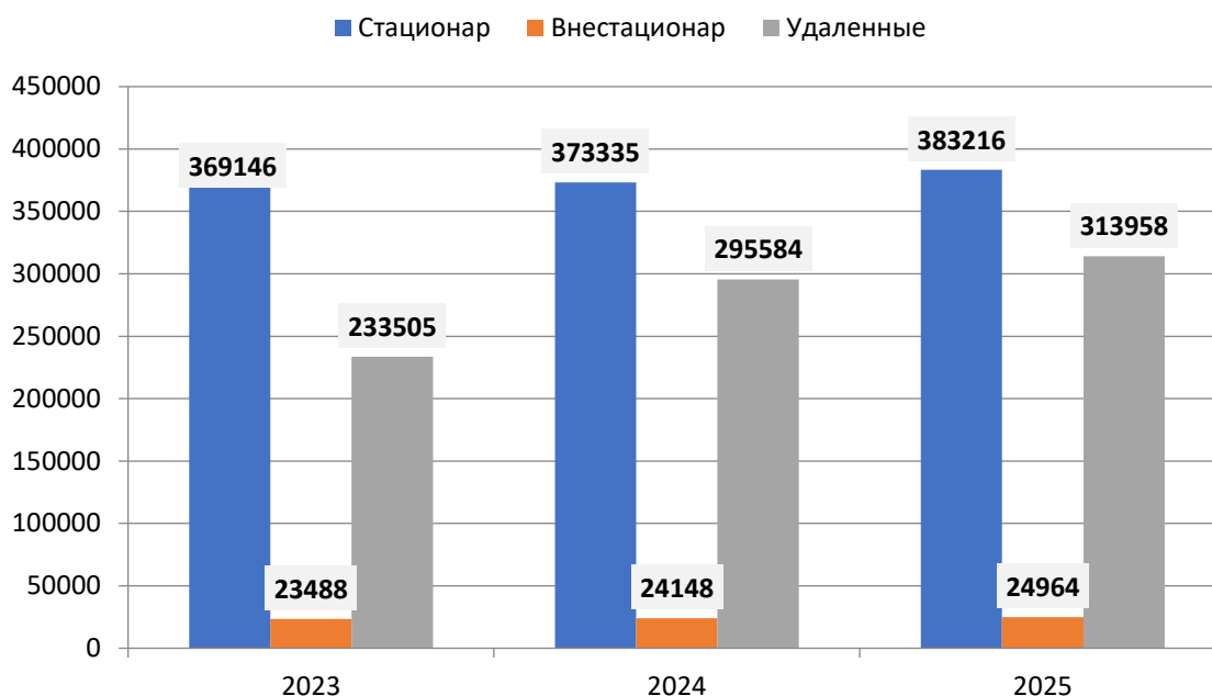
График динамики количества пользователей за три года в регионе