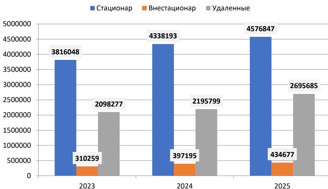
График 2 График количества посещений за три года в регионе